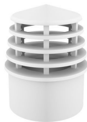
Figura: Terminal de limpeza

Além disso, a tubulação de ventilação deverá obedecer uma distância mínima de 30 cm acima da cobertura, conforme verificado na imagem abaixo: