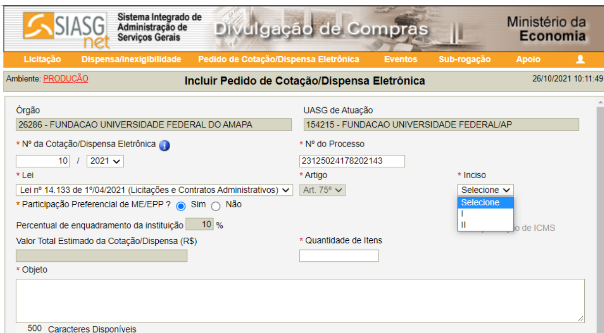
Figura 3 - Lei 14.133/2021 Somente para o Art. 75, I ou II

Desta forma, para que seja dado prosseguimento com o lançamento do SIDEC com a empresa TRATALIX, conforme solicitado no DESPACHO Nº 22010/2021 - REITORIA (11.02) , solicito as seguintes informações: CNPJ, nome da empresa, valor anual da contratação, fundamento legal, justificativa da compra sem licitação e o CATSER.