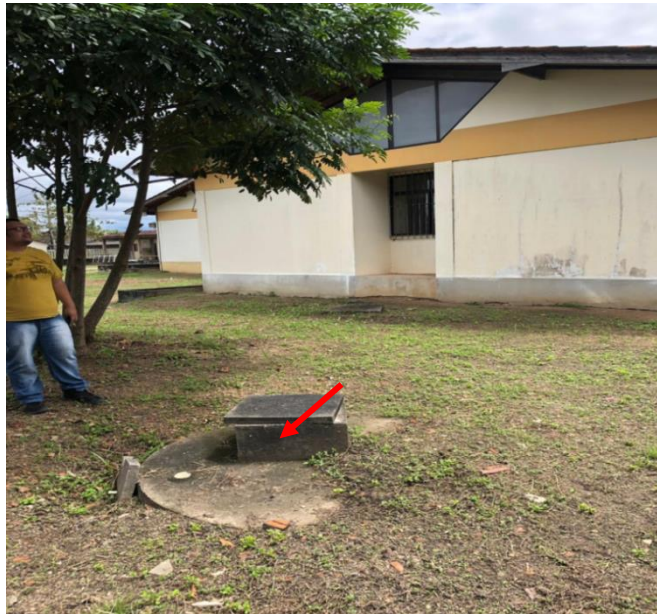
Figura: Fossa a ser desativada

A fossa só poderá ser desativada após o término da construção do novo sistema de tratamento de esgoto. A seguir serão apresentados todos os procedimentos a serem realizados durante a desativação da fossa existente: