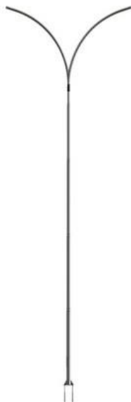
Modelo de Poste cônico contínuo curvo duplo.

O posteamento para iluminação externa será feito através da utilização de postes de aço cônicos contínuos curvos duplos. Observar para que os postes a serem utilizados respeitado os critérios estabelecidos na NBR-14744/2001. Terão altura de 9m (acima do solo) e os braços terão diâmetro mínimo de 60mm. Fixado ao solo por meio de flange com enrijecedores, contendo furo central para passagem de fiação e furação para encaixe dos chumbadores, ou podem ser fixadas por meio de engastamento provido de furo para passagem da fiação. A fixação será sobre base de concreto construída pela contratada. Dimensionado para suportar diferentes velocidades de vento (até 45m/s), conforme NBR 6123. Acabamento – Galvanizado a fogo conforme norma NBR-6323/90, e/ou pintado com pintura eletrostática a pó (outro tipo de pintura a pedido). Podendo ser utilizado o modelo da figura abaixo ou o existente no estacionamento próximo ao Prédio da Farmácia Escola.