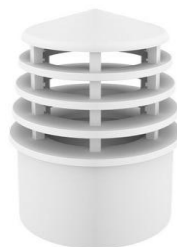
Figura: Terminal de limpeza

Além disso, a tubulação de ventilação deverá obedecer uma distância mínima de 30 cm acima da cobertura, conforme verificado na imagem abaixo: