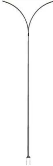
Modelo de Poste cônico contínuo curvo duplo.